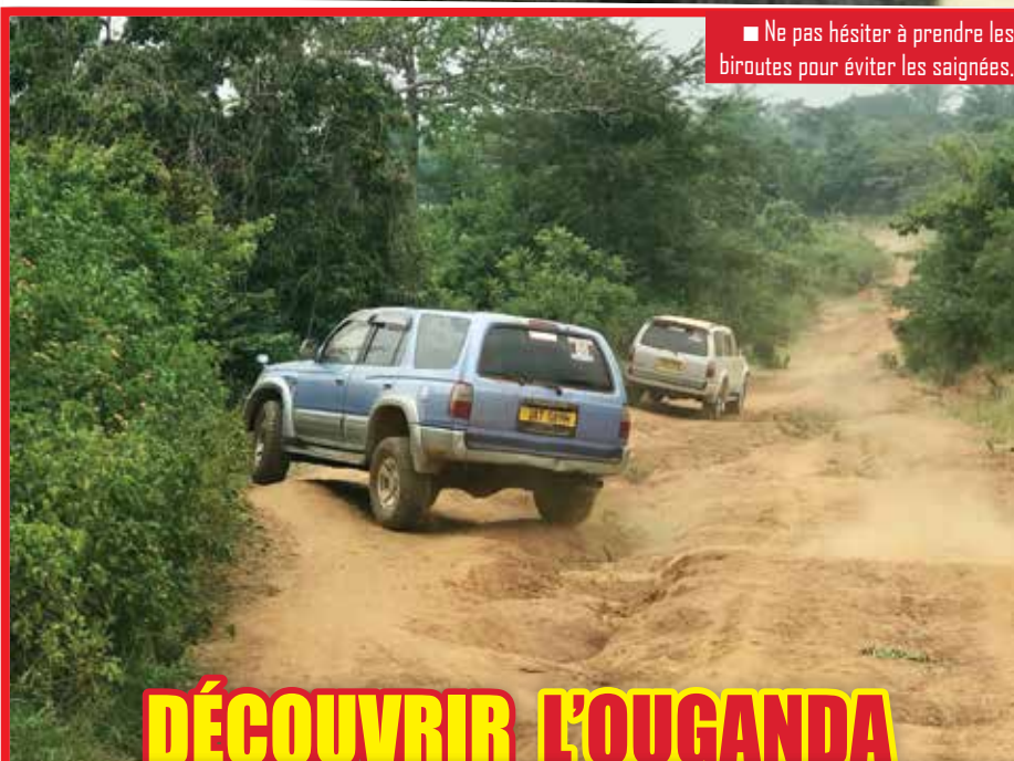
■ Ne pas hésiter à prendre les biroutes pour éviter les saignées.