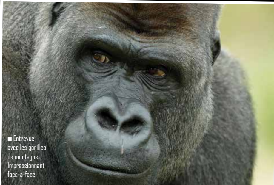
■ Entrevue avec les gorilles de montagne. Impressionnant face-à-face.

■ Les régimes de bananes sont encore acheminés sur les marchés en bicyclettes chinoises.