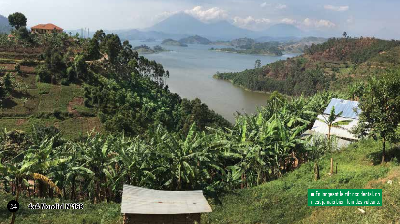
■ En longeant le rift occidental, on n'est jamais bien loin des volcans.

Le voyage tire à sa fin avec des souvenirs plein la tête. Il est encore temps de visiter l'Ouganda mais sans trop tarder car le tourisme va inévitablement prendre de l'ampleur dans les années à venir. On ne peut qu'avoir un gros coup de cœur pour ce pays, l'accueil des gens, les enfants, les couleurs, les paysages, les animaux... Pour qui aime la nature à l'état pur, l'Ouganda fait incontestablement partie des incontournables. ■