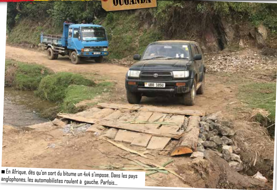
■ En Afrique, dès qu'on sort du bitume un 4x4 s'impose. Dans les pays anglophones, les automobilistes roulent à gauche. Parfois...

nos premiers gorilles en les approchant à seulement quelques mètres. Les mots sont difficiles à trouver pour exprimer ce que l'on peut ressentir, un souvenir impérissable qui restera sans nul doute gravé dans nos mémoires. C'est par une piste très peu empruntée que nous poursuivons notre périple, quelques passages délicats nous rappelleront qu'un 4x4 est indispensable. Nous quittons la forêt, nous sommes en moyenne montagne, le terrain est très accidenté, les points de vue sur les nombreux lacs et leurs îlots sont